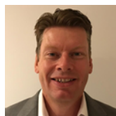
Jonathan Seymour Benchmarks and Index-linked Derivatives. Bloomberg